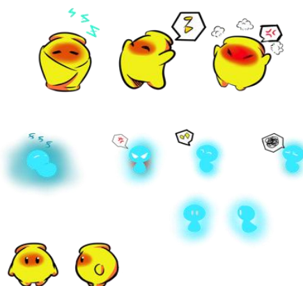
Gambar 3. Maskot kampung keramik Dinoyo