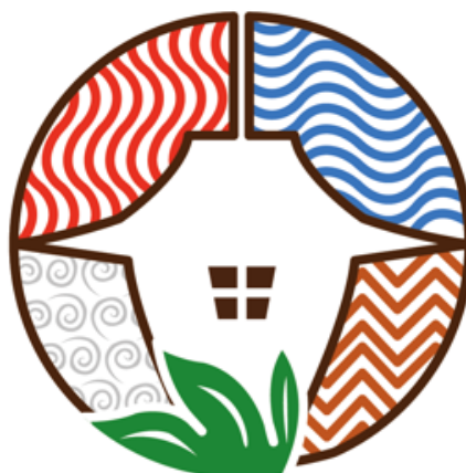
Gambar 1. Logo final kampung keramik Dinoyo Malang.

alam, memiliki kesan ramah yang diimplementasikan pada penggunaan warna, namun dapat diimplementasikan di media apa saja.