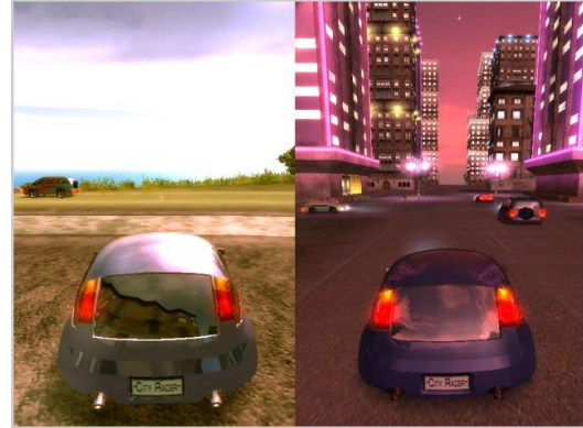
Gambar 2.4. Siang, dan malam hari yang terjadi pada game City Racing .

balap, user berputar-putar di jalanan kota untuk “membuang waktu” menunggu datangnya malam.