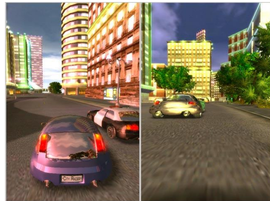
Gambar 2.6. Point Of View (POV) , sudut pandang orang ketiga (kiri), dan sudut pandang orang pertama (kanan).

terdapat pengemudi lain atau tidak, ia adalah orang yang 'berkuasa' atas mobil. Berdasarkan pengamatan, sebagian besar user lebih menyukai POV sudut pandang orang ketiga ini, dengan alasan-alasan teknis seperti kemudahan pandangan terhadap jalan, kontrol yang penuh terhadap seluruh permukaan badan mobil, dan dengan badan mobil yang terlihat secara penuh/utuh, user dapat melihat manuver-manuver yang mereka lakukan layaknya seorang penonton, dan menurut mereka hal ini cukup 'mengasyikan', lalu menghubungkannya dengan dunia nyata seperti "bagaimana jika saya melakukan ini di jalanan yang sesungguhnya". Fantasi tersebut tidak akan ditemui pada POV orang pertama ( first person ), badan mobil yang tidak terlihat dengan utuh menyulitkan user untuk mengontrol keadaan mobil, manuver-manuver menjadi tidak dapat terlihat, user dihadapkan pada sebuah sudut pandang yang kurang begitu dinamis. Meskipun nampak lebih 'nyata' layaknya seseorang yang mengemudikan mobil dalam dunia nyata, namun POV ini kurang memiliki kemampuan untuk membangkitkan fantasi user . Game City Racing telah mengubah persepsi manusia akan ruang, lingkungan virtual mengalami magnifikasi, menjadi lebih penting, dan pada saat yang sama, ruang yang aktual/kongkret mengalami reduksi, ruang aktual menjadi tidak penting.