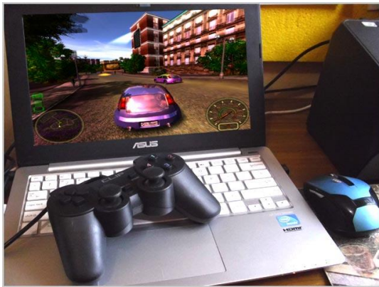
Gambar 2.3. Game City Racing sebagai teknologi simulasi.

teknologi simulasi. Sebuah teknologi yang menciptakan bentuk-bentuk nyata melalui model-model yang tidak memiliki asal-usul atau referensi realitasnya, sehingga memungkinkan manusia untuk membuat yang ilusi, dan fantasi menjadi tampak nyata. Kota yang ada di dalam game tersebut tidak dapat diverifikasi, atau dipahami sebagai kota yang benar-benar ada di pelosok dunia ini, berikut obyek-obyek yang ada didalamnya, oleh karena ia adalah realitas yang artificial , yang dikonstruksi oleh teknologi digital dan bersifat virtual.