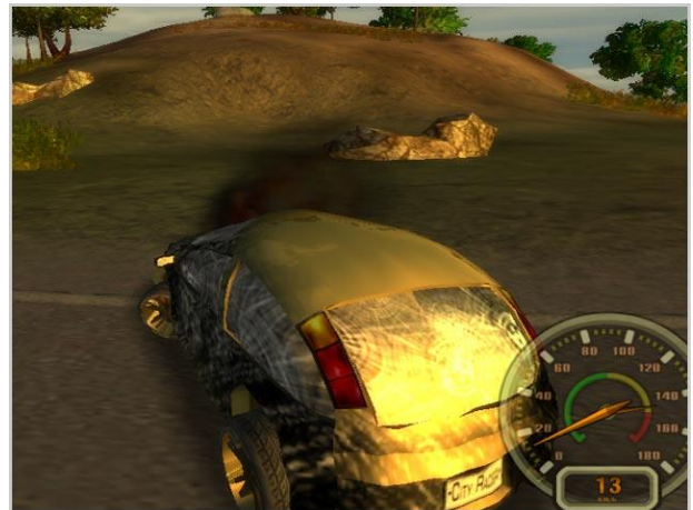
Gambar 2.1. Mobil rusak, salah satu perubahan, atau modifikasi yang dilakukan oleh user terhadap lingkungan virtual.

Ketiga adalah kemampuan untuk memodifikasi lingkungan yang diciptakan komputer, dalam game ini diperlihatkan ketika user merasa sudah bosan dengan warna mobil, dengan pergi ke salah satu workshop di sudut ‘kota virtual’ tersebut, user dapat mengecat ulang mobilnya dengan warna yang lain, atau menambahkan accessories . Disamping itu, akan terjadi perubahan pada lingkungan virtual ketika user dengan mobil yang dikendalikannya menabrak tiang listrik misalnya, maka tiang listrik akan roboh. Atau dengan menabrak mobil lain, baik disengaja atau tak disengaja, memunculkan bekas (penyok/ringsek) pada mobil yang dikendalikan user dan mobil lain yang ditabraknya, hal ini juga menyebabkan mobil jadi melambat dan sukar untuk dikendalikan. Terjadi sebuah perubahan, atau modifikasi yang dilakukan oleh user terhadap lingkungan virtual.