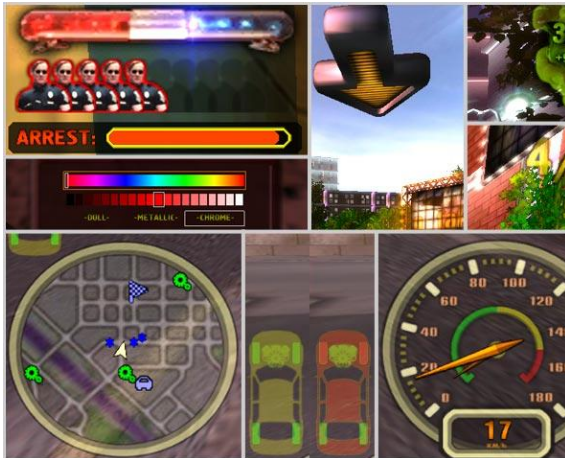
Gambar 2.7. Indeks yang harus ditafsirkan oleh user untuk mempersepsi, dan menyadari keberadaannya.

Yang keenam adalah indeks yang menunjukkan posisi atau urutan mobil yang dikendalikan user dalam sebuah pertandingan balap, serta berapa persen jalan yang telah ditempuh oleh user dari garis start hingga finish. Indeks ini disajikan dalam bentuk angka yang jika ditafsirkan akan membantu untuk mengetahui posisi user , serta membantu untuk menentukan keputusan yang harus dilakukan oleh user , misalnya lebih mempercepat laju mobil, lebih berkonsentrasi dalam mengendalikan mobil untuk menghindari kecelakaan, atau bahkan membatalkan pertandingan pada saat masih berlangsung karena dirasa sudah tidak mungkin untuk memenangkannya.