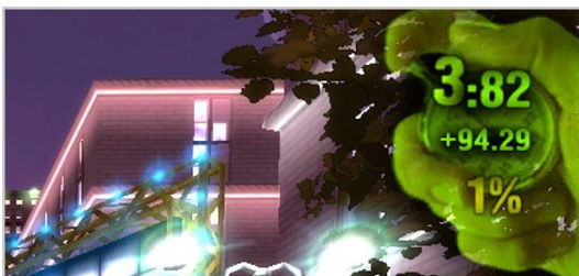
Gambar 2.5. Timer pada mode "Time Trial"