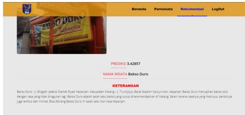
Gambar 7. Tampilan Hasil Rekomendasi