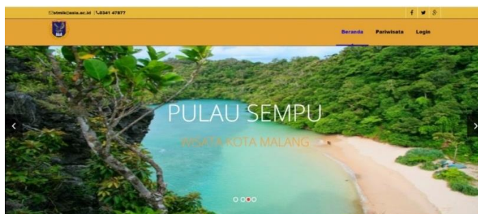
Gambar 2. Halaman Utama Pengunjung

Halaman ini berisikan halaman utama pengunjung yang belum login, untuk mendapatkan rekomendasi maka pengunjung harus login terlebih dahulu. Jika belum login maka pengunjung hanya bisa melihat data tentang wisata-wisata yang ada di Malang.