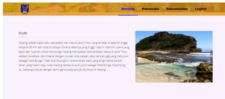
Gambar 5. Halaman Pariwisata

Pada halaman ini pengunjung dapat membaca seputra informasi wisata yang ada di Malang sebagai pembuka pada beranda pengunjung yang mempunyai user name dan password.