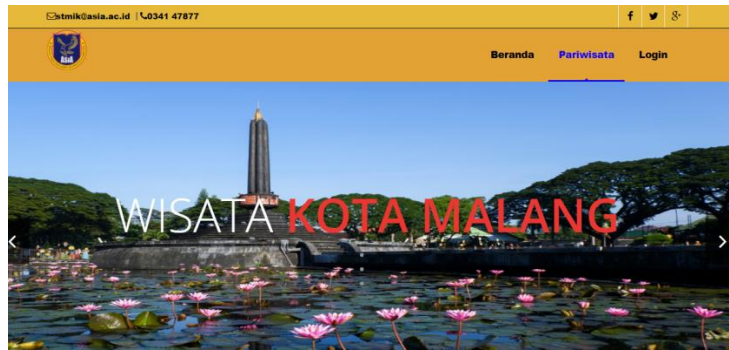
Gambar 4. Halaman Utama Pengunjung Login