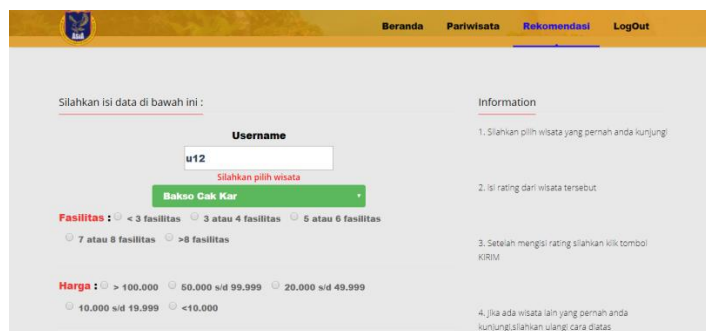
Gambar 6. Halaman Rekomendasi

Halaman ini berisi tentang rating-rating pada tempat wisata yang dikunjungi dan Jika pengunjung belum pernah mengunjungi tempat wisata tersebut dapat mengosongi ratingnya. Dan mencari tempat wisata lain yang sudah dikunjungi untuk diberi penilaian.