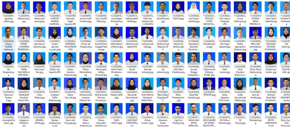
Gambar 2. Pengumpulan data wajah

wajah mahasiswa yang diambil dari berbagai sumber dan kondisi. Foto-foto ini meliputi variasi pose, ekspresi wajah, kondisi pencahayaan, dan latar belakang yang berbeda. Keanekaragaman dataset sangat penting untuk melatih model agar dapat mengenali wajah dalam situasi yang beragam.